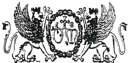
Stemmi dell'Ospedale di S. Maria della Misericordia di Perugia