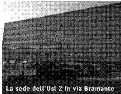
La sede dell'Usl 2 in via Bramante

L'Usl Umbria 2 al primo posto nella classifica della trasparenza dei siti web delle aziende sanitarie: il risultato, grazie al 100% di indicatori soddisfatti (84 su 84), è emerso dall'analisi svolta dal sistema della Bussola della trasparenza , predisposto dal ministero per la Semplificazione e della Pubblica amministrazione. Il motore di ricerca permette il monitoraggio in tempo reale di tutti i siti web registrati nell'indice delle pubbliche amministrazioni (Regioni, Comuni, Aziende ospedaliere, Asl etc.), oltre a funzioni di verifica relative alla consultazione della struttura informativa dei portali istituzionali, alla classifica, alle statistiche delle sezioni pubblicate, agli open data. Il sito web istituzionale dell'azienda Usl Umbria 2 risulta pienamente in linea con tutti i parametri di verifica e di monitoraggio con indice di rispondenza ai nuovi adempimenti pari al 100 per cento: «Si tratta di un risultato di grande importanza – commenta una nota dell'azienda sanitaria – alla luce delle nuove normative che disciplinano il diritto di accesso civico e gli obblighi di pubblicità, trasparenza e diffusione di informazioni da parte delle pubbliche amministrazioni». L'Usl Umbria 2 condivide il primo posto nella classifica insieme all'Azienda sanitaria locale Roma 5 e all'Azienda unità sanitaria locale di Viterbo.