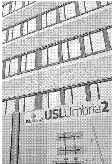
Premiato il sito web Comunicazione della Usl2 premiata dal ministero della Pubblica amministrazione

ti del Decreto legislativo n.33/2013 per le seguenti tipologie di amministrazioni: Asl. Azienda Sanitaria Locale Roma 5 100% 84 / 84 ; Azienda Unità Sanitaria Locale Umbria 2 100% 84/84; Azienda Unità Sanitaria Locale Viterbo 100% 84/84; Azienda Assistenza Sanitaria N.2 Bassa Friulana Isontina 95% 80/84; Azienda Sanitaria Universitaria Integrata di Udine 92% 77/84; Azienda Sanitaria Locale NO 88% 74/84; Azienda Sanitaria Locale N. 4 di Teramo 85% 71/84; Azienda Sanitaria Locale Napoli 1 Centro 85% 71 / 8 ; Azienda Sanitaria Universitaria Integrata di Trieste 83% 70/84. ◀